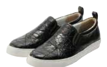
メンズフットウェア部門賞 林 秀玲 (有限会社フューチャー)