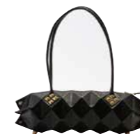
レディースバッグ部門賞 内山 友徳 (MADOROMI)