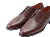
学生部門賞 木村 和哉 (エスペランサ靴学院)