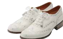
レディースフットウェア部門賞 池田 悠二 / 小島 竜太 (カワノ 株式会社)