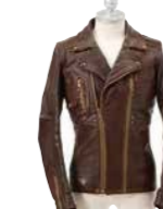
ファッション雑貨部門賞 吉野 真由 (ギャラリークレハ)