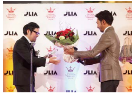
写真はJapan Leather Award 2014表彰式の様子