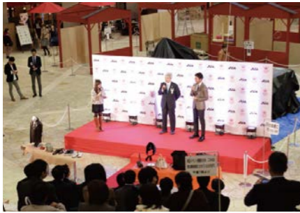
●開催場所：阪急うめだ本店 9F祝祭広場