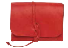
生活雑貨部門賞 永井 よしと (株式会社ペルーリア)