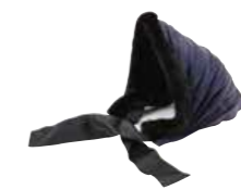
ベストテーマ賞 竹口 真由美 (アトリエ naiade-chapeau)