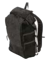
トレンチ賞 山下 めぐみ (株式会社吉田)