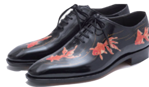
大平 麻理恵 個人