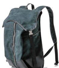
中村 忠裕 (有)ジェイクラフトマン