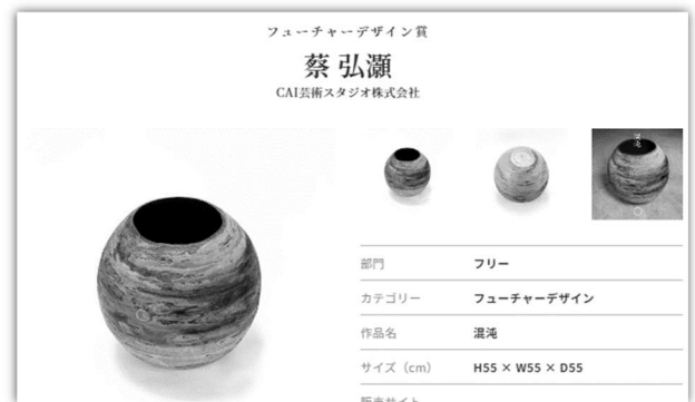
▲公式ウェブサイト「応募作品」ページでの掲載例