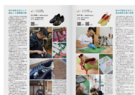
受賞作品紹介小冊子